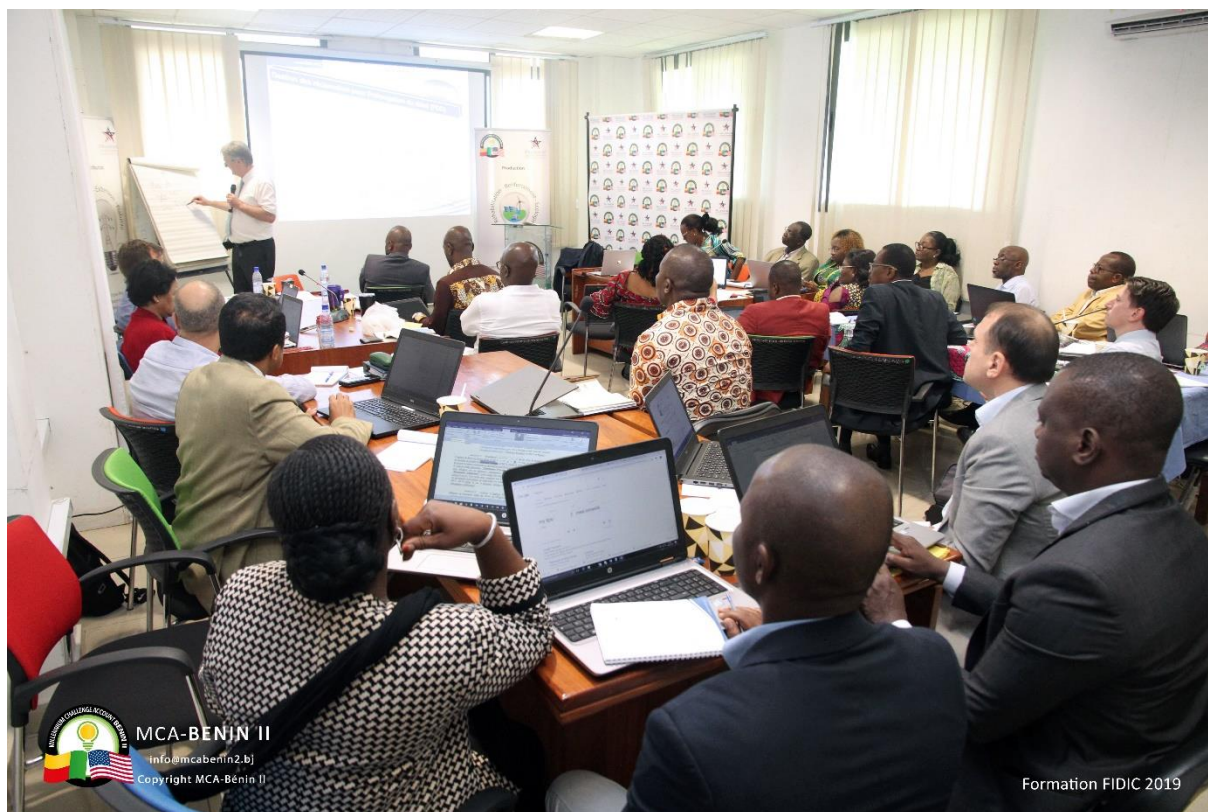
Image n° 1 : Atelier de formation sur les contrats FIDIC pour les travaux de construction