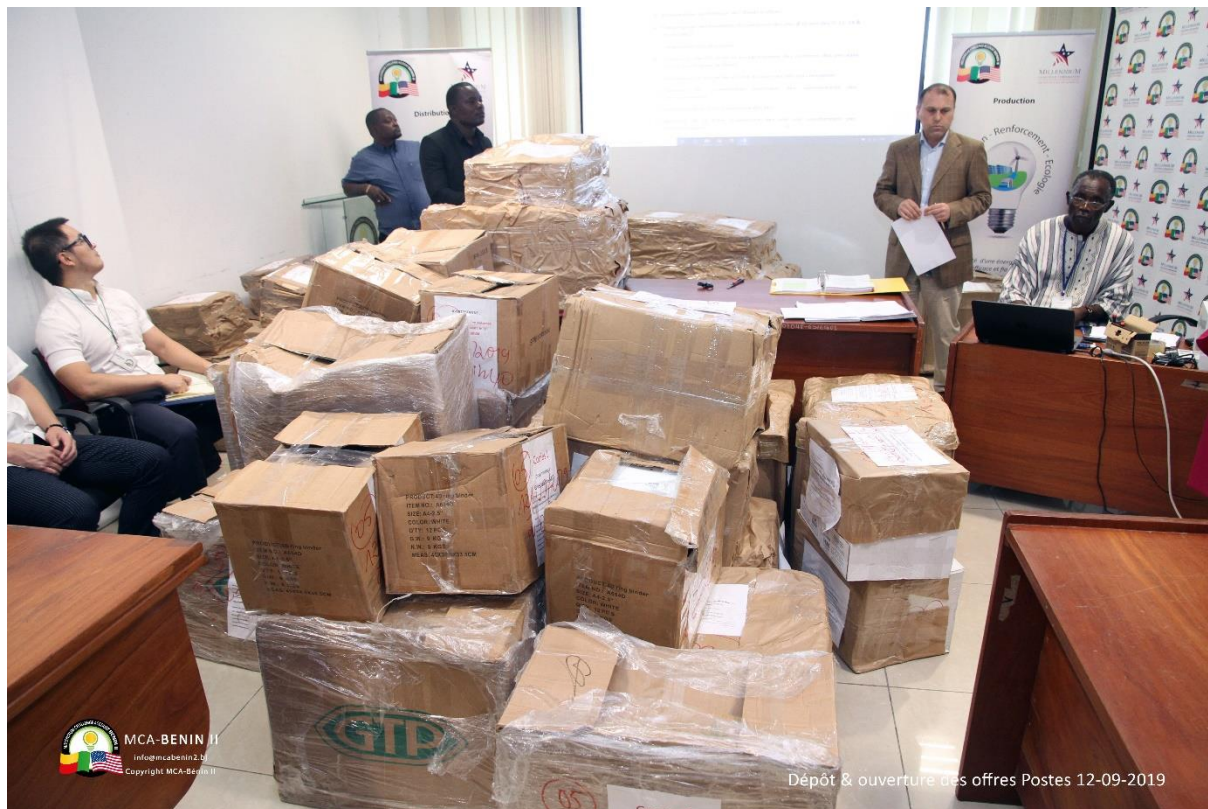
Image n° 3 : Réception et ouverture des offres pour le renforcement des postes électriques