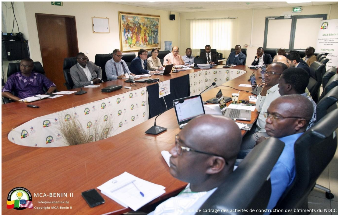
Image n° 3 : Réunion de cadrage des activités de construction des bâtiments du NDCC